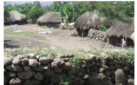
Siedlung der Dani

Nach dem Frühstück fahren Sie nach Jiwika, im nördlichen Teil des Baliem Valleys. Das Dorf ist bekannt für seine über 250-jährige Mumie eines Häuptlings. Nach einem 10-minütigen Spaziergang erreichen Sie das Dorf Anemoigi, wo Sie bei einer nachgestellten Schlacht der Dani zuschauen und sehen wie ein traditionelles Festessen zubereitet wird. Sie lernen, wie die Dani ein traditionelles Feuer machen, ein Schwein mit Pfeil und Bogen