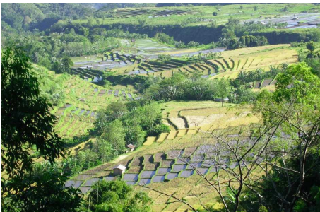
Reisfelder bei Ruteng

Nach dem Frühstück im Hotel fahren Sie in Richtung