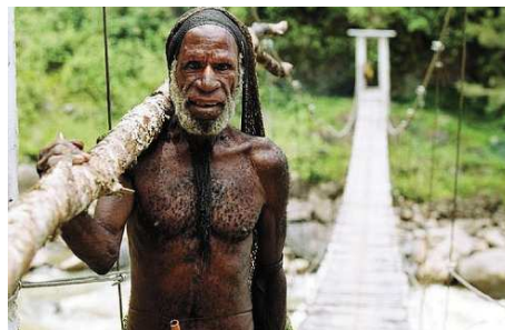
Ureinwohner im Baliem Tal

Der heutige Tag beginnt mit einer kurzen Fahrt zum Dorf Sogokmo, im südlichen Teil des Baliem Valleys. Von hier aus startet Ihre heutige Trekking-Tour, welche ca. 4-5 Stunden dauern wird. Vorbei an Süsskartoffelfeldern der Dani wandern Sie in Richtung Kurima. Geniessen Sie unterwegs die wunderschöne Umgebung und machen Sie Bekanntschaft mit den freundlichen Einheimischen. Nach einem Picknick wandern Sie zurück nach Sogokmo und werden von dort aus wieder nach Wamena gefahren.