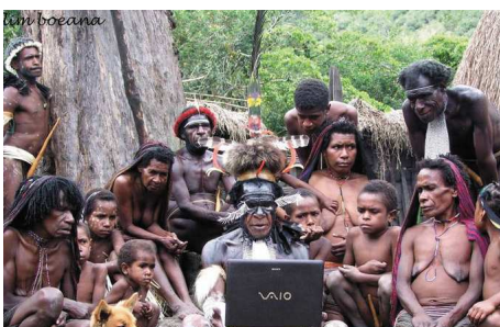
Volk der Dani

Nach der Ankunft in Jayapura werden Sie von unserer Reiseleitung empfangen und zu Ihrem Flug nach Wamena gebracht. Während Sie bei diesem Flug die einmalige Aussicht auf in Nebel gehüllte Berge und Dörfer geniessen, werden Sie verstehen weshalb diese Region während vielen Jahrhunderten von der Aussenwelt isoliert war. Nach der Ankunft im Baliem Valley (Achtung: es gibt hier spezielle Einfuhrbestimmungen für Alkohol) beginnt Ihre Reise in eine andere Welt. Sie besuchen heute Napua Hills von wo Sie eine wunderschöne Aussicht über das Tal haben, das Dorf Wesaput mit seiner traditionellen Hängebrücke, sowie einige Dani Dörfer und einen lokalen Markt. Abendessen und Übernachtung in Wamena.