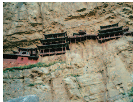
Das hängende Kloster bei Datong

Am Morgen besichtigen Sie die Yungang-Grotten. Die