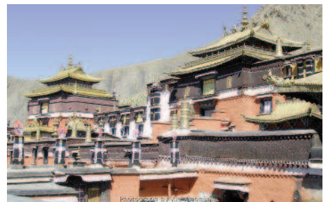
Tashihlunpo Kloster, Shigatse

Tag 15: Shigatse Der heutige Tag ist der Besichtigung der zweitgrössten Stadt Tibets, Shigatse gewidmet. Sie besuchen die im Jahr 1447 erbaute Klosteranlage Tsashihlunpo mit ihren goldenen Dächern. Das Kloster Tsashihlunpodie dient als Residenz des Panchen Lama. Nachmittags frei.