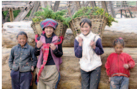
Kinder in Zhongdian

Tag 8: Zhongdian (Shangri-La) Der heutige Tag ist dem Besuch der Kleinstadt Zhongdian der Tibet-Minderheit gewidmet. Sie besichtigen den Sumtselling Kloster und statten einer tibetischen Familie einen Besuch ab.