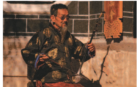
Traditionelle Musik der Naxi-Minderheit

Tag 12: Nach Gyantse Entlang des Tsangpo-Tals durch eine landschaftlich wunderschöne Gegend fahren Sie über den Kampa La Pass (4794m) am türkisch schimmernden Yamdrok-See und an Nomadenzelten und Yak-Herden vorbei und über den Karo La Pass (5010m) nach Gyantse.