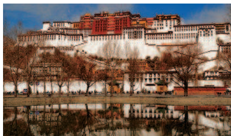
Der Potala Palast in Lhasa

Tag 11: Potala Palast Sie besuchen den im Zentrum gelegenen, 41ha grosse, im 7. Jh. erbaute Potala Palast. Er dient als Residenz der Dalai Lamas und umfasst 1000 Räume. Sein 13stöckiges Hauptgebäude, das aus dem Weissen und dem Roten Palast besteht, ist 115.7 m hoch. Danach besuchen Sie das Kloster Drepung etwas ausserhalb Lhasas, einstmals das grösste und bestimmende Kloster Tibets. In diesem Vatikan Tibets studierten einst Tausende von Mönchen die buddhistische Lehre. Anschliessend besuchen Sie den Norbolingka, den bezaubernden Sommerpalast.