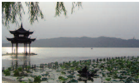
West-See in Hangzhou

Suzhou, auch Venedigs des Ostens genannt, erlangte Weltberühmtheit mit seinen wundervoll gestalteten Gartenanlagen. Neben dem grössten Garten in Suzhou, Garten des tönernen Politikers, besichtigen Sie den Tigerhügel mit seinem schiefen Turm, einen mit der Geschichte dieser Stadt im engen Zusammenhang stehenden Berg. Weiter besuchen Sie die Altstadt. Anschliessend unternehmen Sie einen Ausflug nach Tongli. Dieses gut erhal-