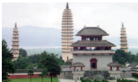
Drei Pagoden Tempel in Dali

Sie besuchen die spektakuläre, 15 km lange Tigersprungschlucht am Yangtse-Fluss.