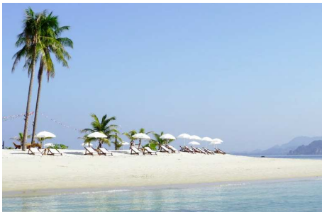
Sivalai Beach, Koh Mook