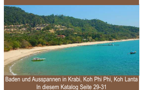
Baden und Ausspannen in Krabi, Koh Phi Phi, Koh Lanta In diesem Katalog Seite 29-31