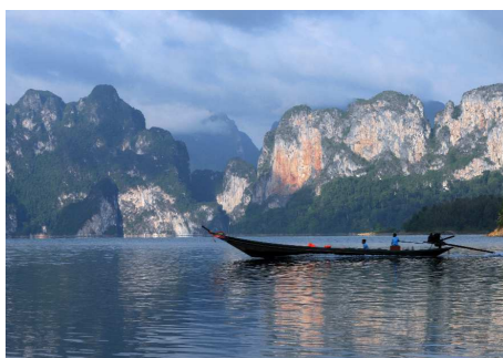
Khao Sok Nationalpark

Diese Reise führt Sie direkt in den grössten Regenwald Südthailands, den Khao Sok Nationalpark. Für Leute, die für ein paar Tage auf Komfort verzichten können, dafür aber durch eine einmalig schöne Flora und Fauna und fantastische Naturschönheiten entschädigt werden, ist diese Reise genau das Richtige.