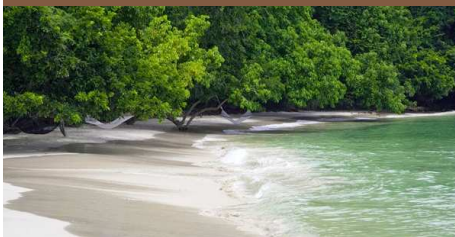
Baden und Ausspannen auf Borneo In diesem Katalog auf Seite 47