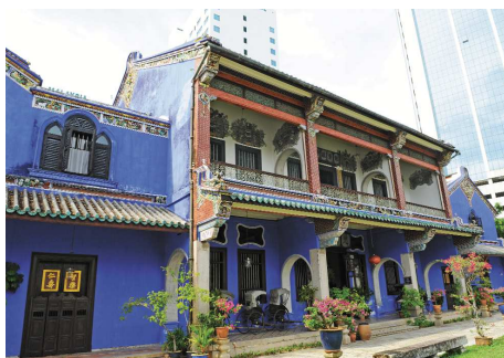
Cheong Fatt Tze, Penang

Nach einer zweistündigen Überlandfahrt durch grüne Landschaften und vorbei an Dörfern der Dusun-Minderheit erreichen Sie die Weltkulturerbe der UNESCO, den Kinabalu Nationalpark mit seinem majestätischen Mount Kinabalu, den höchsten Berg Südostasiens. Nach einem Besuch im Informationscenter machen Sie einen Spaziergang auf 2000 m.ü.M. und entdecken die Fauna und Flora in dieser Hochgebirgsgegend. Übernachtung in einem Resort im Kinabalu Nationalpark.