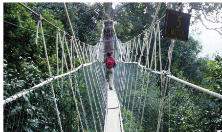
Canopy Walk, Taman Negara

Der Höhepunkt des morgentlichen Trekkings zum Terek Hill ist zweifellos der Canopy Walk, wo Sie über Hängebretchen auf einer Länge von 600m durch die Kronen der Baumriesen den Urwald aus einer Höhe von 30-40m betrachten können. Nach dem Mittagessen können Sie bei einer gemütlichen Bootsfahrt auf dem Tahan Fluss nach Lata Berkoh ein kühles Bad im Fluss nehmen und die Flora und Fauna des Urwalds kennenlernen.