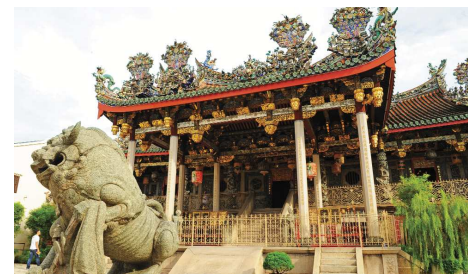
Khoo Kongsi Clan Haus

Transfer zum Flughafen für Ihre individuelle Weiterreise.