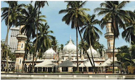
Masjid Jamek, Kuala Lumpur

Auf dieser Rundreise lernen Sie die Highlights West-Malysias kennen. Kuala Lumpur mit seinen imposanten Wolkenkratzern, Taman Negara mit seinem weltältesten Urwald, die Cameron Highlands mit ihren Teeanbaugebieten und schliesslich Penang mit seiner alten Kultur.