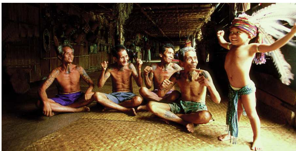
Iban-Männer im Langhaus

Diese Rundreise führt Sie durch den Urwald von Borneo, dabei lernen Sie die Bräuche und Lebensweise der Iban, der Ureinwohner Borneos, kennen. Den Dschungel hautnah zu erleben und die Begegnung mit den in der wilden Natur lebenden, zum Teil vom Aussterben bedrohten Tieren wird Ihnen für lange Zeit ein unvergessliches Erlebnis bleiben.