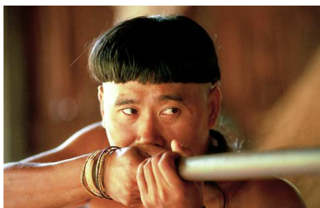
Iban-Mann mit Blaspfeife

Nach dem Frühstück Transfer nach Batang Ai - geniessen Sie eine Fahrt durch grüne Landschaften, vorbei an Reisfeldern, Pfeffergärten und Gummiplantagen ins Land der Iban. Mit dem Boot gelangen Sie zum Hotel, welches am Flussufer liegt.