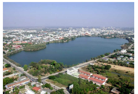
Khon Kaen See

Am Morgen Stadtrundfahrt in Khon Kaen und Besuch des Bueng Kaen Nakhon Sees sowie des Früchtemarkts Banglamphu. Check-out und Transfer zum Flughafen. Flug nach Bangkok und Transfer zum Hotel.