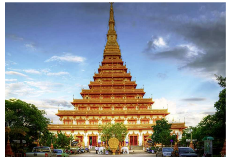
Phra Mahathat Kaen Nakhon

Fahrt nach Phra Buddha Bat Bua Bok, welches am Fusse des Phupan Berges liegt und wo man den „Bua Bok Buddha Fussabdruck“ sehen kann. Dieser ist auf ca. 900-1000 v.Chr. datiert und ist seit 1920 mit einem Chedi überdacht. In dieser Anlage findet man auch einige Höhlen mit Wandmalereien. Weiterfahrt nach Khon Kaen, Nachmittags zur freien Verfügung. Abendessen und Übernachtung in Khon Kaen.