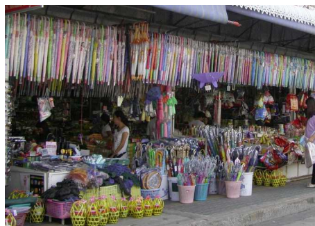
Indochina Markt in Mukdahan

Fahrt zum Chong Mek Markt an der Grenze zu Laos. Anschliessend Weiterfahrt zum Pha Taem Nationalpark. Nach dem Mittagessen in einem lokalen Restaurant genießen Sie eine kurze Bootsfahrt auf dem Mekong und erreichen Khong Chiam. Unterwegs besuchen Sie einen Wasserfall sowie den Maenam Song Si, auch zweifarbiger Fluss genannt und die Stelle wo sich der braune Mekong und der blaue Mun Fluss treffen. Abendessen und Übernachtung in Khong Chiam.