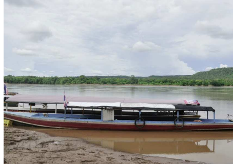
Der Mekong bei Khong Chiam

und Mittagessen unterwegs. Anschliessend Fahrt nach Ban Pa Ao, einem der ältesten Dörfer in Ubon Ratchathani. Besuch der Ausgrabungsstätte Ban Kan Lueang. Auf der Weiterfahrt zum Hotel besichtigen Sie den Tempel Wat Thung Si Muang. Abendessen und Übernachtung in Ubon Ratchathani.