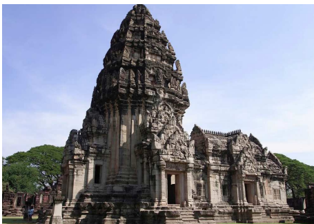
Khmer Tempelkomplex in Phimai

Am Morgen werden Sie in Ihrem Hotel abgeholt und fahren in Richtung Korat. Unterwegs halten Sie beim Lam Takong Damm, wo Sie die wunderschöne Aussicht genießen. Nach dem Mittagessen in einem lokalen Restaurant fahren Sie zum «Angkor Wat von Thailand» Prasat Hin Phimai, dem grössten Khmer Tempelkomplex in Thailand. Weiter geht es zum Töpferdorf Ban Dan Kwian, wo Sie auch einen Markt besuchen. Danach Weiterfahrt nach Korat, wo Sie das Denkmal Thao Suranaree besichtigen, welches zu Ehren ihrer Grosstat für Khun Ying Mo errichtet wurde. Abendessen und Übernachtung in Korat.