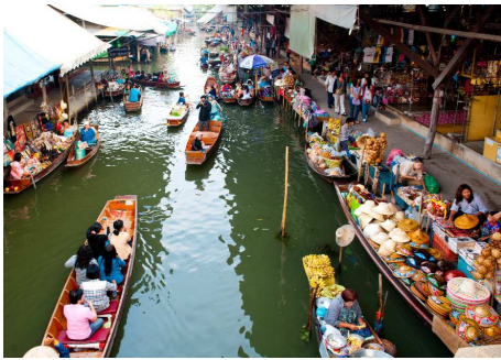
Schwimmender Markt Damnoen Saduak