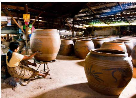
Töpferei in Ratchaburi

Sie werden in Ihrem Hotel in Bangkok abgeholt und fahren zum Mae Klong Markt, der sogenannte „Railway Market“ welcher direkt auf dem Gleis abgehalten wird. Bei jeder Zugsdurchfahrt ziehen sich die Händler zurück; sobald der Zug vorbei gefahren ist werden die Stände wieder aufgebaut. Anschliessend geht es weiter zum Amphawa Markt, dem beliebtesten Schwimmenden Markt in der Nähe von Bangkok. Eine grosse Zahl von Händlern auf ihren Booten bieten ihre Ware an: Obst, Gemüse, Blumen, Gewürze und Speisen. Nach einer kurzen Bootsfahrt besuchen Sie den Wat Bang Kung, einen Tempel aus der Ayutthaya-Zeit welcher in einem Banyan Baum eingewachsen ist. Anschliessend Fahrt zum Tempel Wat Pumarin Kudi Thong. Weiterfahrt Richtung Petchburi, Mittagessen unterwegs. Sie besuchen die Khao Luang Höhle mit ihren