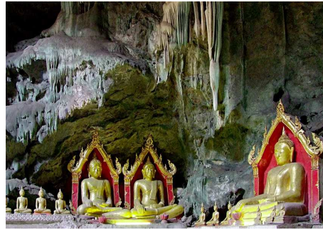
Khao Luang Höhle

Am Morgen fahren Sie zum Sam Roi Yot Nationalpark. Unterwegs halten Sie bei einer Garnelenzucht. Ebenfalls geniessen Sie eine Bootsfahrt und wandern anschliessend zur Phraya Nakhon Höhle. Diese Höhle besteht