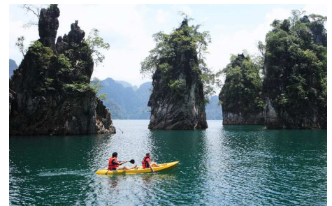
Kanufahrt im Khao Sok Nationalpark

Sie fahren weiter südlich in Richtung Takuapa, der grössten Stadt in der Region. Sie passieren Dörfer, Gummi- und Palmölplantagen. Anschliessend unternehmen Sie eine Bootsfahrt durch die Mangrovenwälder. Für unternehmenslustige Teilnehmer stehen Kanus für eine Fahrt auf den kleinen Flüssen bereit. Weiter fahren Sie mit einer Dschunke entlang der Küste, während Ihnen das Mittagessen an Bord serviert wird. Transfer nach Phuket am Nachmittag.