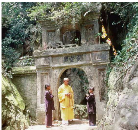
Marmorberg bei Danang

Auf einem Boot verbringen Sie den Vormittag zwischen den über 3000 Inseln und Felskegeln der malerischen Bucht und besichtigen eine Höhle. Am frühen Nachmittag fahren Sie zum Flughafen Hanoi und ein kurzer Inlandflug bringt Sie nach Danang.