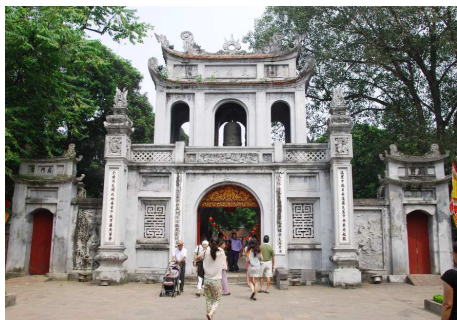
Literatur Tempel, Hanoi

Entdecken Sie die landschaftliche Schönheit und kulturelle Vielfalt des Landes. Diese exklusive Reise vermittelt Ihnen einen Einblick in die Sitten und Bräuche der Bevölkerung und führt Sie gleichzeitig zu den wichtigsten Sehenswürdigkeiten und zu einmalig schönen Landschaften. Die ideale Reise, um Vietnam in allen seinen Facetten kennenzulernen.