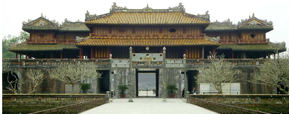
Haupttor zur Kaiserlichen Zitadelle, Hue

Auf dem Landweg fahren Sie von Hoi An nach Hue und besichtigen unterwegs My Son, das frühere religiöse Zentrum des Königreichs von Champa, einer hochentwickelten Zivilisation, welche die Region vom 4. bis zum 13. Jh. beherrschte. Ebenfalls besuchen Sie in Danang das bekannte Cham-Museum, welches die wohl beste Sammlung von Cham-Kunst auf der ganzen Welt beherbergt.