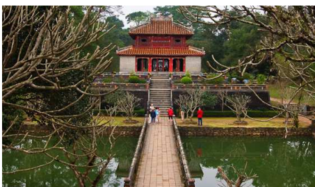
Kaiserliches Grab von Minh Mang

Den Vormittag verbringen Sie noch einmal zwischen den über 3000 Inseln und Felskegeln der Bucht. Die Schönheit dieser märchenhaften Welt wird Sie begeistern. Am Nachmittag Rückkehr nach Hanoi und Flug nach Hue.