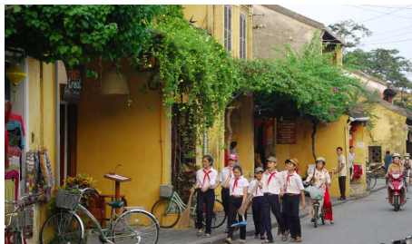
Schulkinder in Hoi An

Die hervorragend erhaltene Händlerstadt Hoi An wurde 1999 zum UNESCO-Welterbe erklärt. Heute nehmen Sie an einem Stadtrundgang zu Fuss teil. Gehen Sie am Nachmittag an Bord eines örtlichen Boots und fahren Sie dem Thu Bon Fluss entlang, wobei Sie die unberührte Landschaft geniessen.