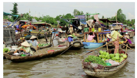
Im Mekong Delta

Mit dem Auto geht es in Richtung Mekong Delta. Auf einem Boot tauchen Sie ein in eine grüne Welt voller Kanäle, kleiner versteckter Dörfer, endloser Früchteplantagen und Reisfelder. Am Abend werden Sie zurück nach Saigon gefahren.