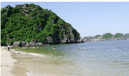
Insel Cat Ba

Fahrt ins Dorf Xa Linh, wo Ihr 4tägiges Trekking beginnt. Über einen steilen Dschungel-Gebirgspfad erreichen Sie ein H'mong Dorf für ein spätes Mittagessen. Am Nachmittag führt der Weg meist bergabwärts, vorbei an Teichen und über Hängebrücken, die schmale Flüsse überspannen. Gegen Abend erreichen Sie das kleine Dorf Van, von wo Sie einen wunderbaren Ausblick auf das Mai Chau Tal geniessen. Abendessen und Übernachtung im Dorf-Gästehaus. Gesamte Wanderstrecke 18-20km.