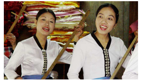
Haus auf Stelzen, Mai Chau Tal

die Mittagspause. Am Nachmittag passieren Sie mehrere Dörfer der Thai Minderheit, bevor Sie ihr heutiges Ziel Kho Muong erreichen. Auch dieses Dorf gehört zur Weissen Thai Minderheit, deren Gäste Sie heute Nacht sind. Gesamte Wanderstrecke ca. 17km.