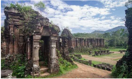
UNESCO Weltkulturerbe My Son

Bei dieser Reise durch Zentralvietnam lernen Sie einerseits viele über die Kultur und Geschichte, sehen aber auch das einfache Leben auf dem Land. Eine abwechslungsreiche Reise für jung und alt.