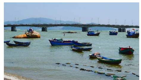
Fischerboote, Nha Trang

Mit dem Boot unternehmen Sie einen Ausflug zu einer nahegelegenen Insel, wo Sie durch das charmante Fischerdorf schlendern und eine Fahrt auf einem Korbboot machen. Am Nachmittag geniessen Sie auf einer einstündigen Bootsfahrt die Aussicht auf die Küste Nha Trangs und besichtigen anschliessend unter anderem die uralten