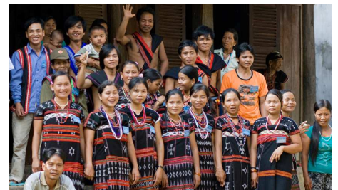
Co Tu Volk, Quang Nam

Nach dem Frühstück fahren Sie ca. 3 Stunden entlang des Ho Chi Minh Pfads (Nr. 14) nach A Luoi Stadt. Erleben Sie die spektakuläre Landschaft der Truong Son Bergkette. Sie fahren zum Dorf A Roang und beginnen die erste Hälfte des Tages mit einer Wanderung durch das Dorf. Das Mittagessen wird in der Haushalle des Dorfes