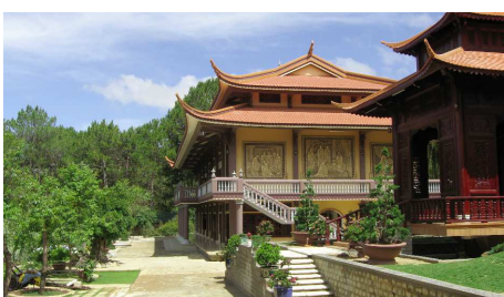
Truc Lam Zen Kloster, Dalat

Der ganze Tag steht Ihnen zur freien Verfügung bis zum Transfer zum Flughafen für Ihre Weiterreise.