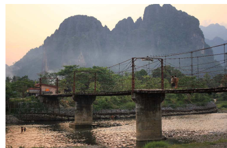
Landschaft in Vang Vieng

Bei einer Stadtrundfahrt mit Besuch der verschiedenen Tempelanlagen wie Wat Xieng Thong und Wat Wisunalat erfahren Sie viel Wissenswertes über diese alte Königsstadt. Rechtzeitig zum Sonnenuntergang besteigen Sie den Tempelberg von Phu Si, von wo aus Sie eine spektakuläre Sicht über die Stadt haben.