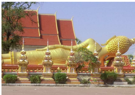
Wat That Luang, Vientiane

Nach der Ankunft und dem Transfer zum Hotel führt Sie eine ausführliche Tour zu den Höhepunkten von Vientiane. Die Hauptstadt von Laos ist verglichen mit anderen asiatischen Kapitalen noch immer eine verschlafene Stadt mit viel Charme, baumbestandenen Alleen, interessanten Tempeln und farbenprächtigen Märkten.