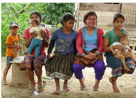
Khmu Minorität bei Luang Prabang

Nach einem kurzen Besuch einer der quirligen Märkte geht es zur Ebene der Tonkrüge. Auf diesem Gebiet rund um Phonsavanh befinden sich über 300 riesige Tonkrüge, welche zwischen 1 und 3.25m hoch sind und bis zu 6 Tonnen wiegen. Diese sind schätzungsweise zwischen 2500 und 3000 Jahre alt. Über ihren Zweck gibt es verschiedenen Theorien – eine davon ist diese, dass der damalige König Khun Chuang diese erschaffen liess für die Lagerung von Wein, mit welchem seine Eroberung der Provinz gefeiert werden sollte. Weiter geht der Ausflug nach Muang Khoun, wo Sie mehrere Tempel besichtigen. Fahrt zurück nach Phonsavanh.