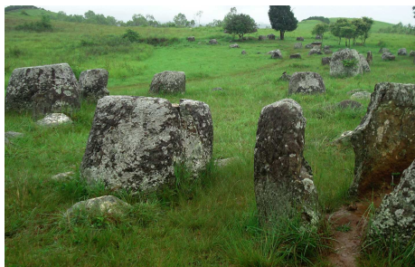
Ebene der Tonkrüge

Die Reise führt Sie über Land von Vientiane nach Luang Prabang. Nach einem kurzen Halt in Vientiane und Vang Vieng geht es weiter in Richtung Norden nach Phonsavanh. Dieses Gebiet ist auch bekannt als die Ebene der Tonkrüge – über 300 Tonkrüge, welche z.T. bis 6 Tonnen wiegen, befinden sich hier. Als Abschluss der Reise erkunden Sie das bezaubernde Luang Prabang und seine Umgebung.