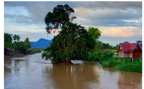
Mekong im Süden Laos

Transfer zum Flughafen für Ihre Weiterreise.