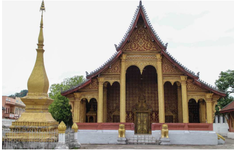
Wat Sene, Luang Prabang

Nach der Ankunft und dem Transfer zum Hotel führt Sie eine ausführliche Tour zu den Höhepunkten Vientianes. Die Hauptstadt von Laos ist verglichen mit anderen asiatischen Kapitalen noch immer eine überschaubare Stadt mit viel Charme, baumbestandenen Alleen, interessanten Tempeln und farbenprächtigen Märkten.