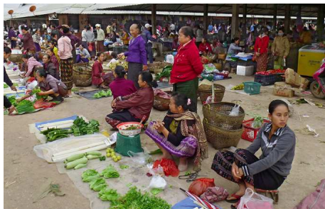
Markt in Muang Xing

Auf der Fahrt nach Muang Xay halten Sie in verschiedenen Minderheitendörfern an und beim Tad Lak Sip-Et Wasserfall. Weiter geht es nach Muang Xay. Besuchen Sie den lokalen Markt und geniessen Sie den traumhaften Blick auf Muang Xay, den man vom Hügel Phou Xay hat.