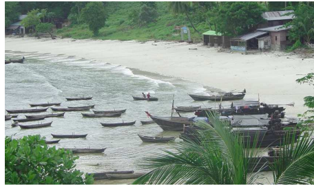
Mergui-Archipel, Moken Village

nach Myeik (Mergui). Sie spazieren durch die Innenstadt, vorbei an alten Häusern im Kolonialstil und einer portugiesischen Kirche, die Seite an Seite mit einer Pagode steht. Erleben Sie den Sonnenuntergang bei der Theindawgyi Pagode, von deren Terrasse aus man einen herrlichen Blick über den Hafen hat.