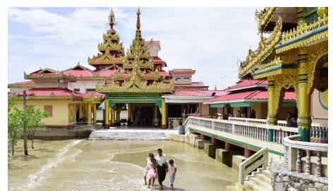
Yelet Hpaya Pagoda, Kyaik Kami

Am Morgen Fahrt in südlicher Richtung nach Thanbyuzat.