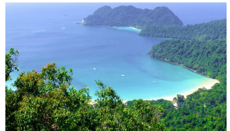
Myanmar Andaman Resort

Rückfahrt mit dem Boot nach Ranong und Weiterreise.