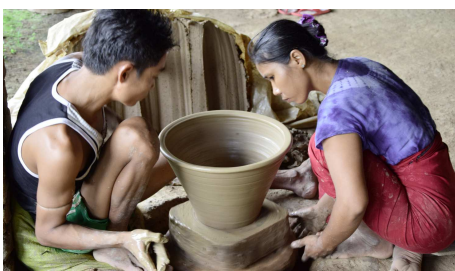
Töpferei bei Bago

Sie erleben den Sonnenaufgang am Goldenen Felsen, der auch heute noch als wichtiger Wallfahrtsort der Burmesen gilt. Nach einer Besichtigung der Tempelanlagen und Höhlen in der Umgebung fahren Sie nach Hpa-an.