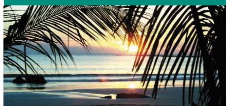
Baden und Ausspannen am Strand von Ngapali Seite 60-61 in diesem Katalog