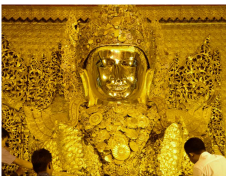
Mahamuni Pagode, Mandalay

Als erstes führt Sie die Tour zum Mahagandayon Kloster, wo Sie beobachten können wie sich hunderte Mönche in einer Schlange aufreihen, um ihr gespendetes Essen in Empfang zu nehmen. Anschliessend geht es zur U Bein Brücke - eine malerische Teakholzbrücke, die sich mehr als einen Kilometer über den Taungthaman See spannt. Zurück in Mandalay, besuchen Sie die Mahamuni Pagode. Sie besichtigen u.a. ebenfalls das Shwenandaw Kloster, das Goldene Teakholzkloster, die Pagoden von Kyauktawgyi und Kuthodaw. Zum Sonnenuntergang besuchen Sie den Mandalay Hill.