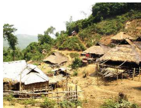
Bergdorf bei Kengtung

Sie die gemütliche Fahrt auf einem der schönsten Seen Indochinas. Sie besuchen einen örtlichen Markt und das Intha Dorf. Das Besichtigungsprogramm enthält ebenfalls einen Besuch bei der Phaung Daw Oo Pagode, dem Inn Paw Khon Dorf und dem Nga Phe Kyaung Kloster.