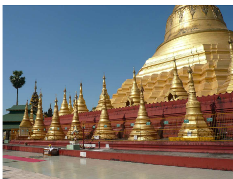
Shwe San Daw Pagoda, Twante

Eine ausführliche Stadtrundfahrt führt Sie zu verschiedenen Pagoden der Hauptstadt. Unter anderem besichtigen Sie die Tempel von Shwedagon und Botataung sowie das Nationalmuseum und den umtriebigen Bogyoke Aung San Markt.